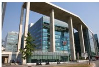
Arcs de Seine